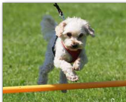
Sprünge auf dem ausgesteckten Parcours!