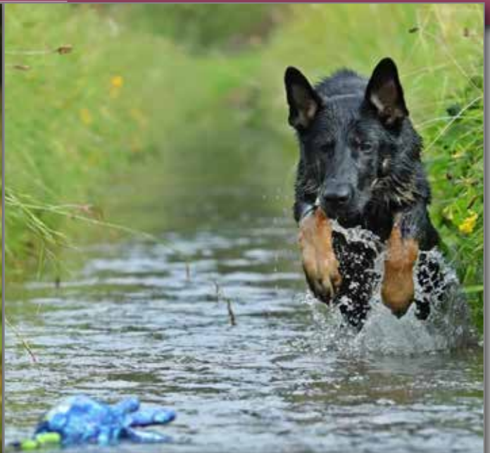
«Gioja zum Blitzstein» 5 Monate alt. Unser 6er im Lotto. Fröhlich, verspielt, sehr arbeitswillig und immer zu einem Streich aufgelegt! Gabriela Stucki aus Boll BE