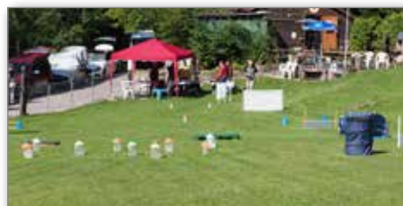
Der Empfang und Informationsstand.

Auf dem Klubgelände an der Hinterdorfstrasse in Zell im Tösstal / ZH erwartete die Besu-