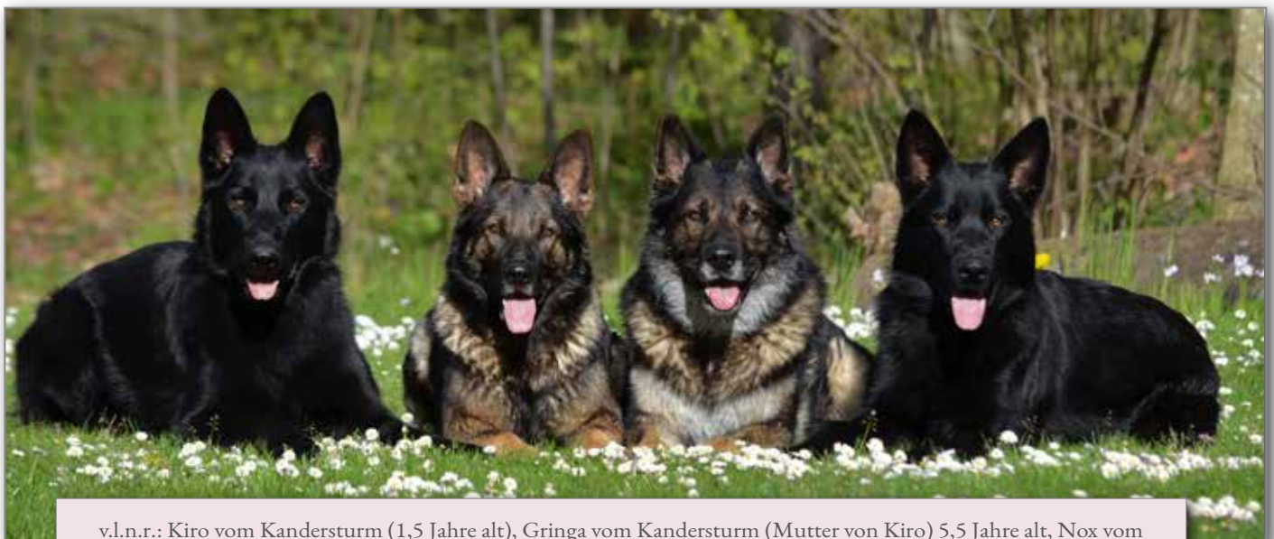
v.l.n.r.: Kiro vom Kandersturm (1,5 Jahre alt), Gringa vom Kandersturm (Mutter von Kiro) 5,5 Jahre alt, Nox vom Hexensturm (10 3/4 Jahre alt), Renox vom Hochheimer Stein (Sohn von Nox) 9 Monate alt.